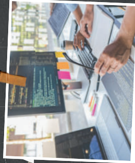
IT: Fachinformatiker für Anwendungsentwicklung (m/w/x)

Du lernst Methoden der Projektplanung, -durchführung und -kontrolle