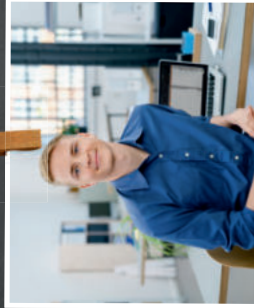
Büro: Kaufmann für Büromanagement (m/w/x)

Du lernst verschiedene Softwareentwicklungswerkzeuge kennen und bringst diese in Deinem täglichen Arbeitstag zum Einsatz