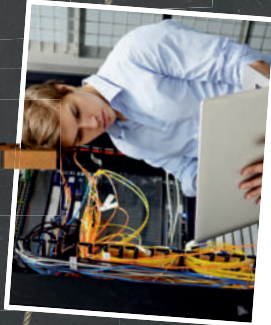
IT: Fachinformatiker für Systemintegration (m/w/x)

Du unterstützt unsere Anwender bei Fragen zur Arbeitsplatzausstattung und Systemanwendung