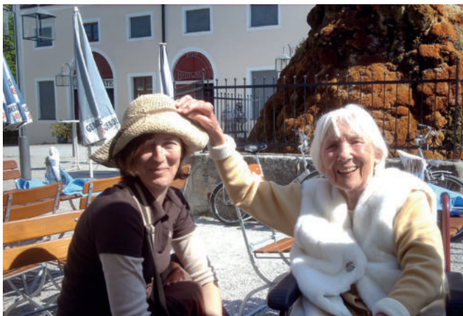
Gepflegte Unterhaltung bei zahlreichen Ausflügen und Veranstaltungen

In familiärer Atmosphäre erleben unsere Bewohner aktivierende Pflege und Betreuung sowie ein außergewöhnlich großes, vielseitiges Beschäftigungs- und Veranstaltungsangebot mit regelmäßigen Ausflügen.